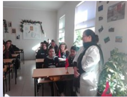
BioBlitz shkon në shkollën 9-vjeçare "Gjergj Fishta", Lezhë