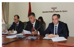
Ministri i Mjedisit, z. Lefter Koka, prezantoi në Komisionin Parlamentar për Veprimtarinë Prodhuese, Tregtinë dhe Mjedisin, projektbuxhetin e Ministrisë së Mjedisit për vitin 2016.

Në fjalën e tij, ministri Koka theksoi se: "Buxheti i Ministrisë së Mjedisit për vitin 2016, në tërësinë e tij, shënon një rritje të konsiderueshme prej 49,37%, duke u rritur nga 2,379,121,000 lekë në vitin 2015 në 3,553,800 në vitin 2016."